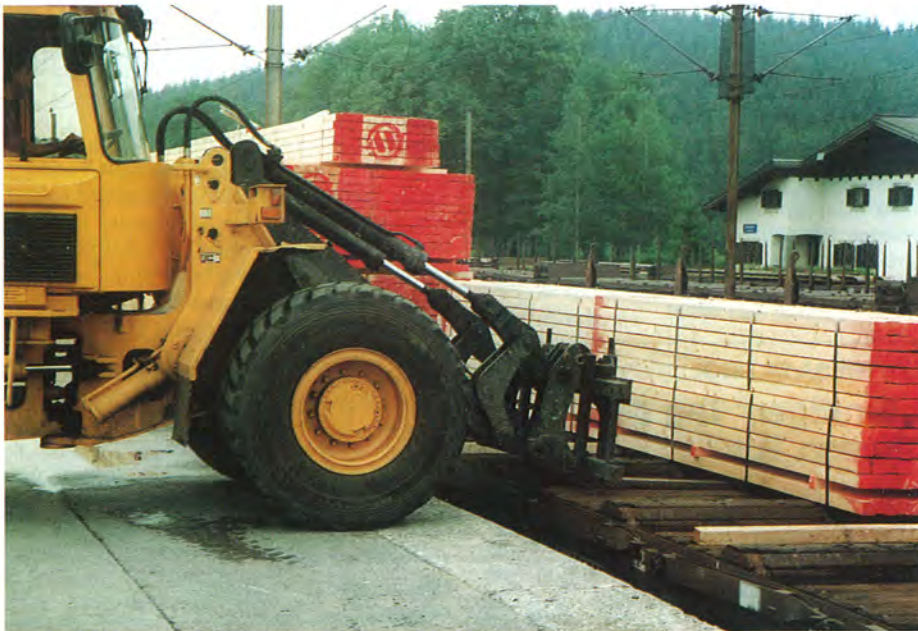
Verladung am Heimatbahnhof