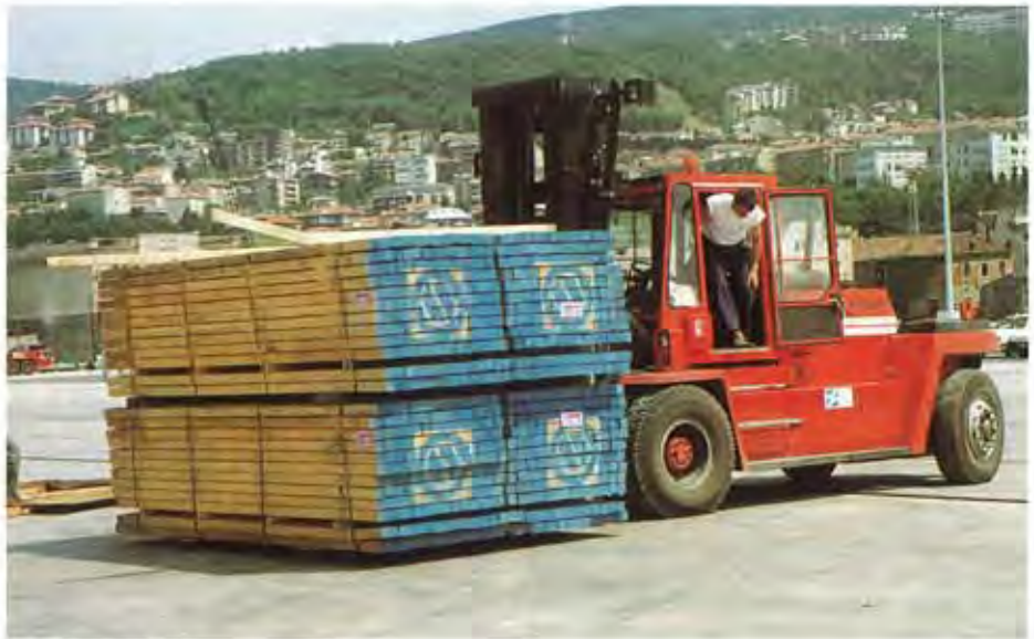
Entladung in Rijeka

Diese Möglichkeit wissen auch hin und wieder Lieferanten aus der Sä-