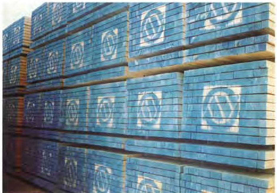
Qualitätsware wird verschifft