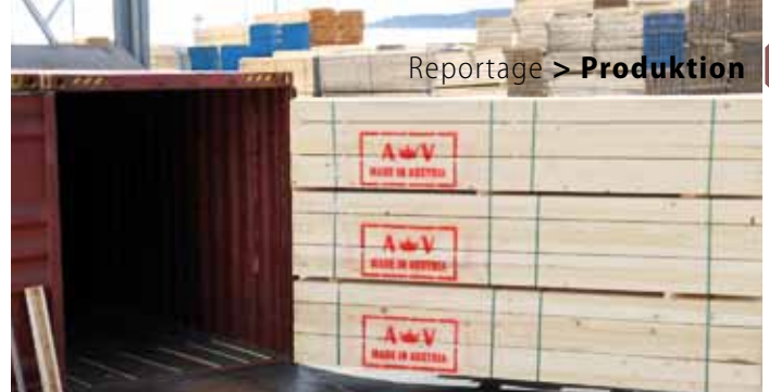
Vor fünf Jahren Premiere durch Vesely: Container-Verladung von Schnittholz Richtung Arabischer Golf

Um die volle Flexibilität zu haben, wären zwei oder drei Schiffe besser", ist seine Überlegung.