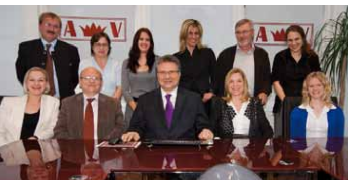
Elfköpfiges Team: Vom Stammsitz in Wien aus erfolgen Ein- und Verkauf

Eine weitere Besonderheit von Vesely Export ist die Gesellschaftsform: eingetragenes Unternehmen (e. U.). Vesely: „Ich trage bei Verlusten die volle persönliche Haftung. Das traue ich mich, weil ich nicht vorhabe, rote Zahlen zu schreiben.“ GE