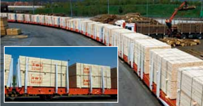
Per Ganzzug und Lkw nach Koper: So verlassen für Vesely über 200.000 m 3 /J die Produktionsstätten